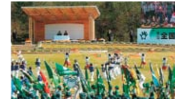
全国育樹祭セレモニー風景

記念広場は、18,000㎡の広芝生をはじめ、あずまや、パーゴラ等の施設があります。