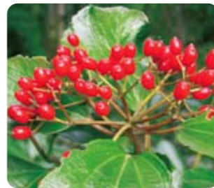
赤く熟した果実(11月)